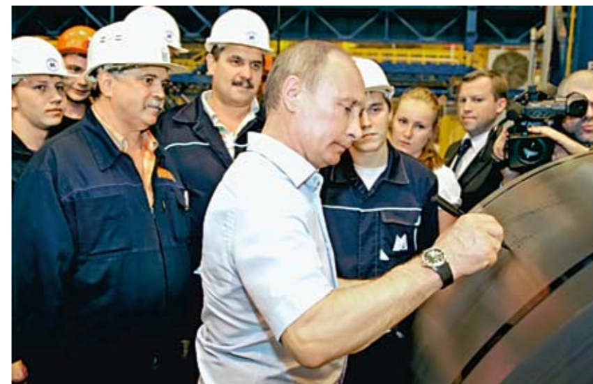
Президент РФ принял участие в запуске второй очереди стана-2000 Магнитогорского металлургического комбината, июль 2012 г.

В СТРУКТУРЕ НАЛОГОВЫХ ПОСТУПЛЕНИЙ ДОЛЯ КЛЮЧЕВЫХ ОТРАСЛЕЙ ЗА ТРИ КВАРТАЛА 2012 Г. СОСТАВИЛА: ТРАНСПОРТ И СВЯЗЬ — 9,3 ПРОЦЕНТА, ПРОИЗВОДСТВО ПИЩЕВЫХ ПРОДУКТОВ — 8,5 ПРОЦЕНТА, МЕТАЛЛУРГИЧЕСКОЕ ПРОИЗВОДСТВО — 7,6 ПРОЦЕНТА, ФИНАНСОВАЯ ДЕЯТЕЛЬНОСТЬ — 5,9 ПРОЦЕНТА, ПРОИЗВОДСТВО МАШИН И ОБОРУДОВАНИЯ — 5,3 ПРОЦЕНТА, СТРОИТЕЛЬСТВО — 4,1 ПРОЦЕНТА, ДОБЫЧА ПОЛЕЗНЫХ ИСКОПАЕМЫХ — 2,3 ПРОЦЕНТА, ПРОИЗВОДСТВО ЭЛЕКТРОЭНЕРГИИ — 2,3 ПРОЦЕНТА. ЛИДИРУЮЩИЕ ПОЗИЦИИ В СТРУКТУРЕ НАЛОГОВЫХ ПОСТУПЛЕНИЙ ЗАНИМАЮТ ОПТОВАЯ И РОЗНИЧНАЯ ТОРГОВЛЯ, ОПЕРАЦИИ С НЕДВИЖИМЫМ ИМУЩЕСТВОМ, УСЛУГИ — 21,7 ПРОЦЕНТА (В МОСКВЕ — 48 ПРОЦЕНТОВ).