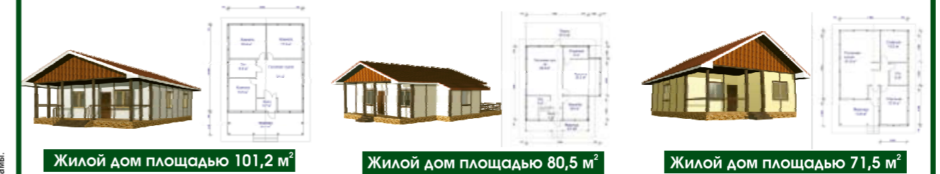
Жилой дом площадью 101,2 м 2