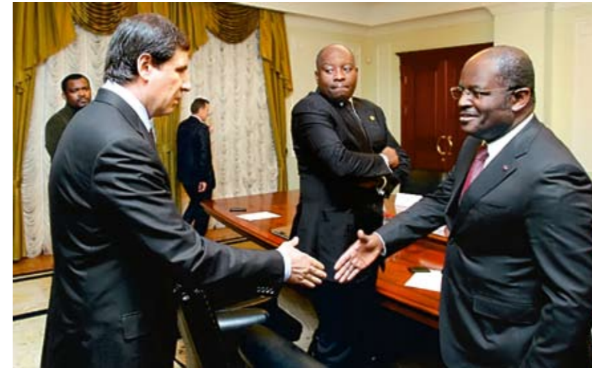
Глава региона встретился с министром промышленности Габона, ноябрь 2012 г.

Европа, США и Китай. Визиты были крайне насыщенными. В Италии, к примеру, подписано соглашение с компанией «Даниэли». Это мощнейшая инженеринговая фирма, можно сказать, лидер разработок оборудования для металлургии. Она планирует открыть в Челябинске крупный сервисный центр с объемом инвестиций в 50