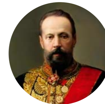
Сергей Юльевич Витте, министр финансов, председатель Комитета министров, председатель Совета министров

И только в конце XIX века состоялся ренессанс общественных предпринимательских объединений, вызванный прогрессивными реформами Александра II. К началу XX века в России действовало уже не менее 150 общественных объединений предпринимателей, имеющих представительские функции.