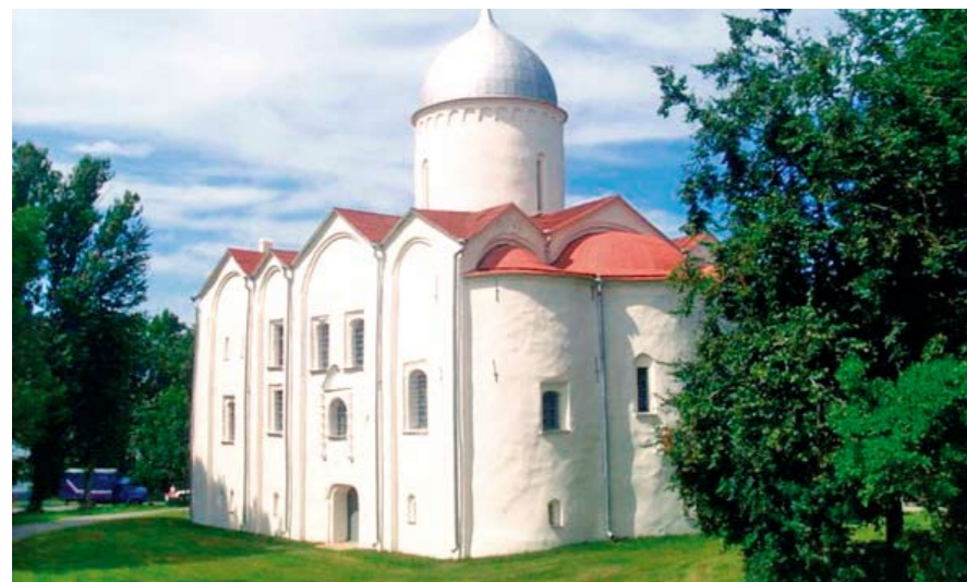
Церковь Св. Иоанна Предтечи в Опоках, Великий Новгород

Источник: Три эпохи в одном веке. К 100-летию первого закона в России «О создании торгово-промышленных палат»/ В.И. Федотов. — 2017. — С. 6–8.