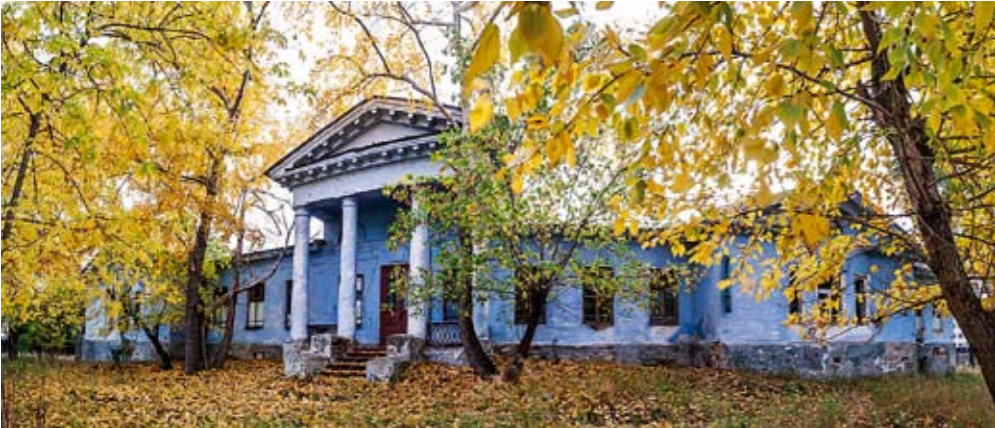
Каслинский заводской госпиталь