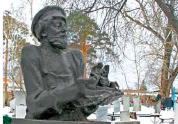
Бюст мастера В.Ф. Торокина