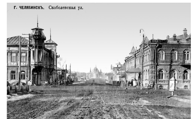
1914 год. Челябинск. «Номера Дядина». Угол улиц Скобелевской и Азиатской (Коммуны и Елькина). В настоящее время в реконструированном здании находится служба ГУВД.