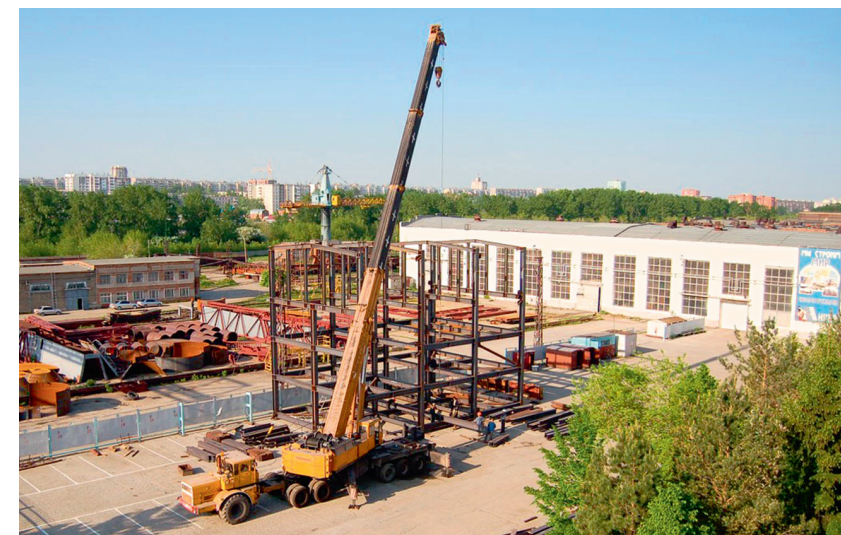
Контрольная сборка модуля трубопроводных эстакад для объекта «Ванкорнефть» на территории завода.