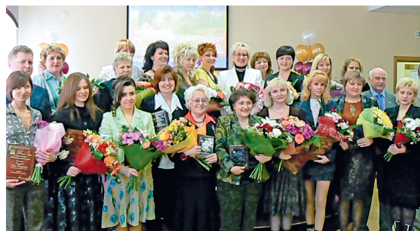
Победители областного конкурса «Женщина — директор года» в ЮУТПП.

С целью популяризации и повышения имиджа женского и семейного предпринимательства наши женщины принимают участие в авторитетнейших всероссийских, региональных конкурсах, ассамблеях и конференциях. За четыре года более 180 женщин Южного Урала стали их победителями.