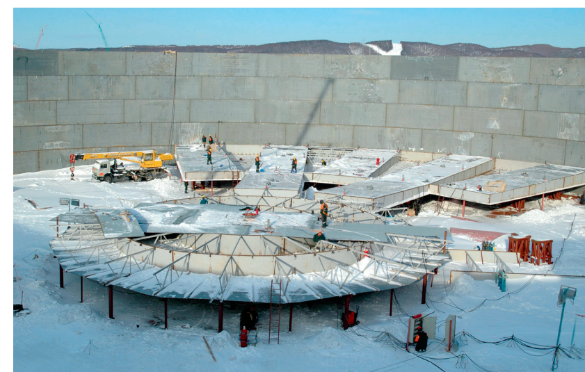
Монтаж плавающей кровли резервуара объемом 100 000 куб.м на объекте Сахалин-I.