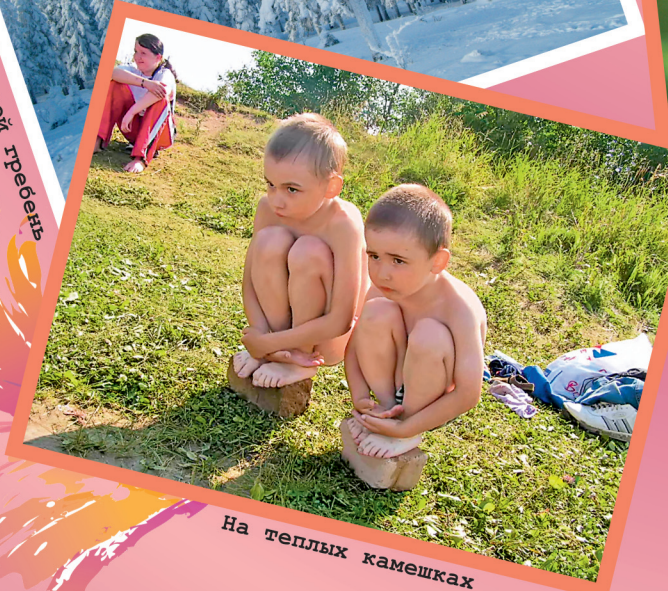
На теплых камешках