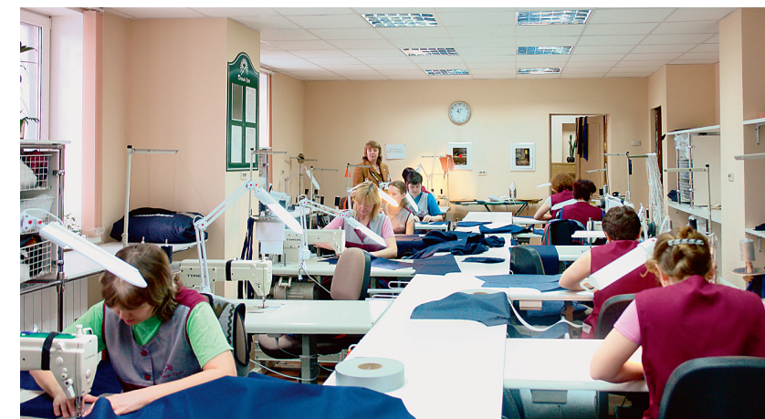
Швейный цех предприятия «Таганай-Урал».

31 предприниматель уже прошел конкурсный отбор, в том числе 16 предприятий женского и семейного предпринимательства, которые на площадях бизнес-инкубатора занимаются проектированием промышленного оборудования, производством оборудования для стеновых конструкций малоэтажных домов, производством монолитного пенобетона, цементоопилочных плит, изготовлением пластиковых окон, производством мясных и колбасных изделий, обуви. Предпринимателям предоставлены офисные помещения на 144 рабочих места, оборудованные мебелью, компьютерами, оргтехникой на льготных условиях: арендная плата за год состав-